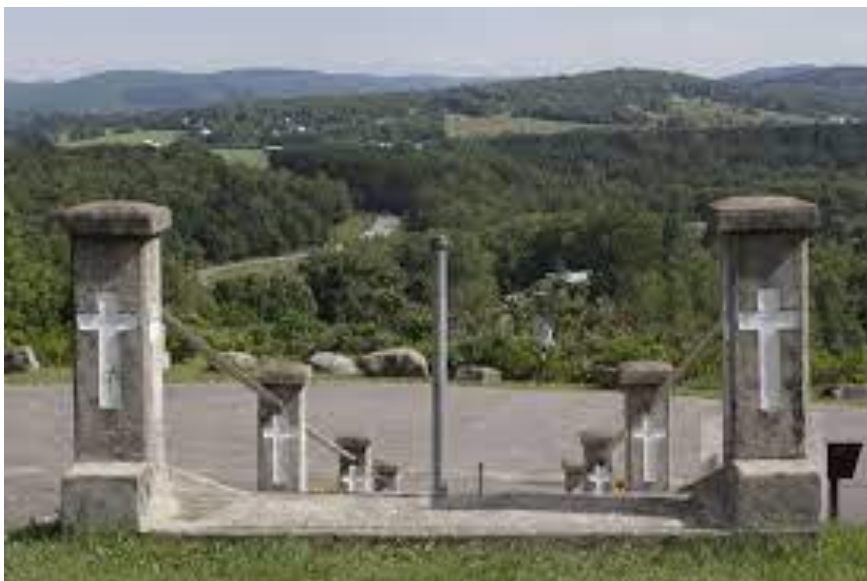
Image d'archive, point de vue du Calvaire d'Huberdeau