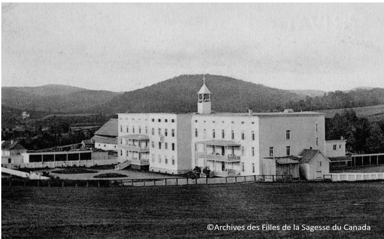
Image d'archive, orphelinat agricole à Huberdeau vers 1910